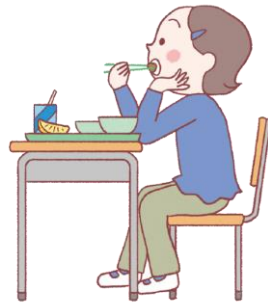
ひじをついて食べる