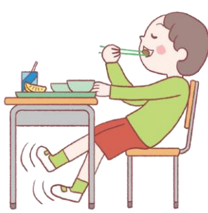
足を床につけない