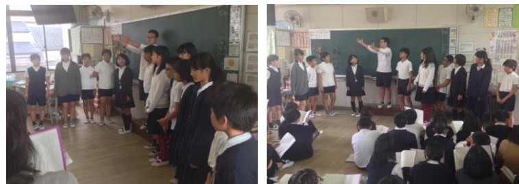
6年生の練習風景です。

ストーリーの展開に応じてセリフや振りを工夫して、子どもたちと一緒に作り上げていきます。そこには、よりよい表現を追い求める指導者の熱い思いがあります。子どもたちも、それに応えようと一生懸命に練習します。こうした活動の中から、子どもたちの「より洗練された表現」が生まれます。よりよいものをつくりだす努力をする―そんな貴重な体験をしてほしいと思います。学芸会は、11月22日(土)です。ぜひ、子どもたちの頑張りを前に来てください。たくさんの方のご来校をお待ちしています。