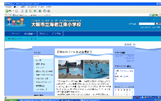
リニューアルしたHPのトップページ

本校には、これまでにホームページはあったのですが、記載内容の変更には教育委員会への手続きが必要で多くの手間と時間がかかっていました。これからは、それらもスムーズになり、学校の旬の情報をその都度お届けしていきたいと考えています。