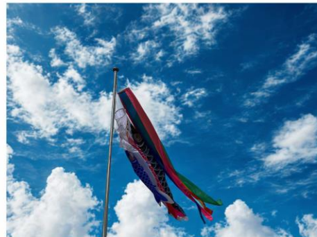
(海老江西幼稚園の鯉のぼりです)