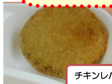
チキンレバーカツ