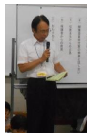
校長先生の あいさつ