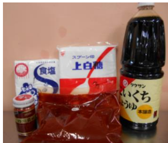
給食のチリソースの材料