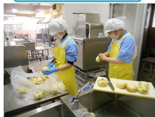
一富士フードサービスの方々