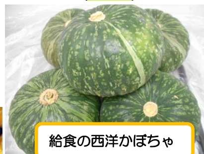
給食の西洋かぼちゃ

○昨日4年生が社会科の「健康なくらしとまちづくり」の勉強として、パッカー車体験学習を行いました。環境事業局の方々からごみのゆくえなどを教えていただきました。学校にやって来たパッカー車の壁面の絵は、昨年のこどもポスターコンクールで入賞した上福島小学校の2年生の児童の絵でした。