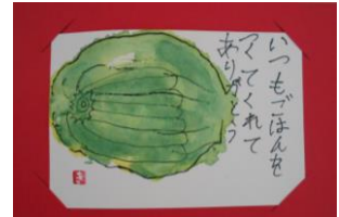
1年生の時のピーマンの絵手紙

がつ きゅうしよく しょくいくしゅうかん まいにちきゅうしよく つく ○1月の給食・食育週間で毎日給食を作ってくださっている(株)一富士フードサービスの かたがた かんしゃ きも か てがみ かきょうしつ 方々に感謝の気持ちを書いたお手紙を各教室 まえ けいじ 前に掲示します。