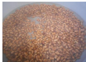
熱湯につけているうずら豆

○今日のかむかむメニューの「うずら豆」は、いんげん豆のなかまです。見た目がうずらたまごのからの模様に似ているところから名前がつきました。給食では、熱湯に30分間つけたあと、やわらかくなるまで煮て、さとうで味つけし、しお、バターを加えました。