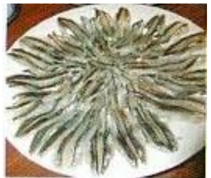
きびなごの菊花造り