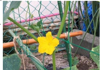
なかよし畑の毛馬きゅうりの花

きょう ○今日のかむかむメニューの「きゅうりのピクルス」のきゅうりは、 か やさい きいろ はな さ やく パーセント ウリ科の野菜です。黄色い花を咲かせます。きゅうりは、約95 % すいぶん ねっちゅうしょう よぼう なつば すいぶんほきゅう が水分です。熱中症の予防など夏場の水分補給にもおすすめ です。なかよし畑では、3、4年生がなになの伝統野菜の け ま さいばい でんとうやさい 「毛馬きゅうり」を栽培しています。