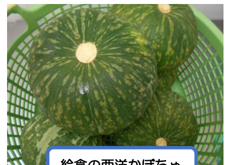
給食の西洋かぼちゃ