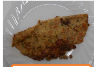
具だくさんオムレツ