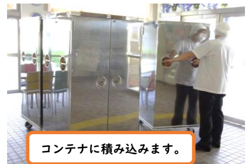
コンテナに積み込みます。