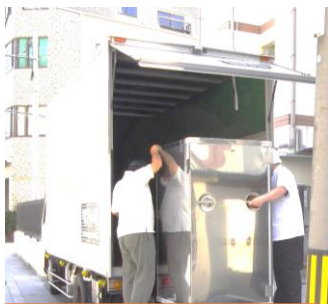
トラックに積み込みます。