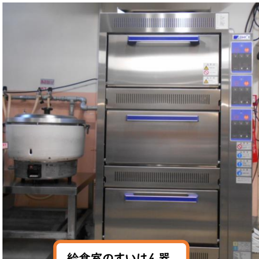
給食室のすいはん器

がつ きゅうしよく こんねんどうしゅうかく しんまい しやう 12月の給食から今年度収穫した新米を使用しています。