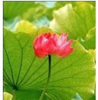
これが「蓮の花」です。

○「市販のりんご」と「上福のりんご」を 比べて、みなさんはどんなことに気づ くでしょう? たくさんのことを考えなが ら、近いうちに、全員で味わいたいと 思います。