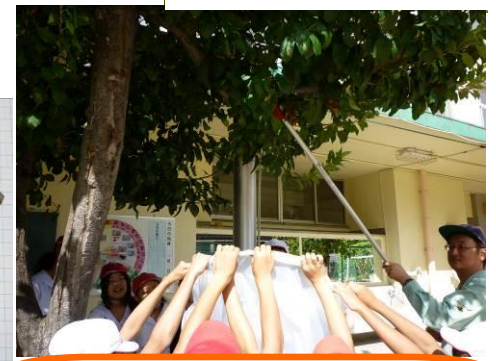
みんな違ってみんないい「上福のりんご」です。