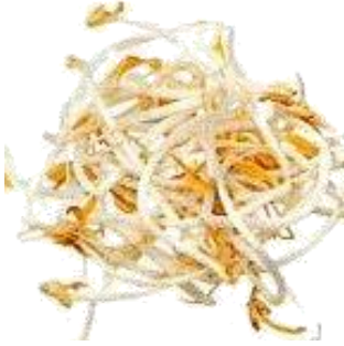
りょくとうもやし