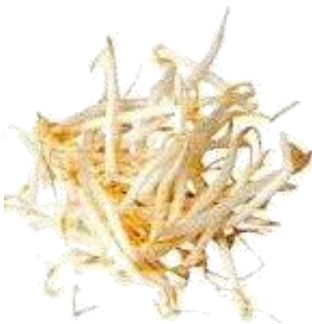
ブラックマッペもやし