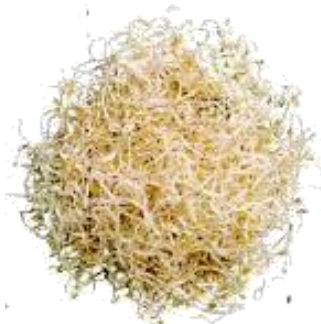
アルファルファもやし