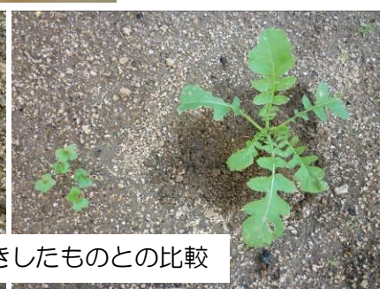
2回目(10月21日)種まきしたものとの比較