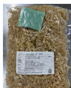
こめこのマカロニ