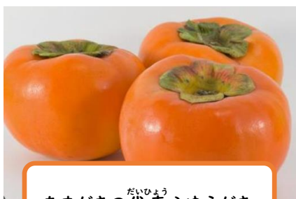
あまがきの代表ふゆうがき