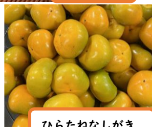
ひらたねなしがき