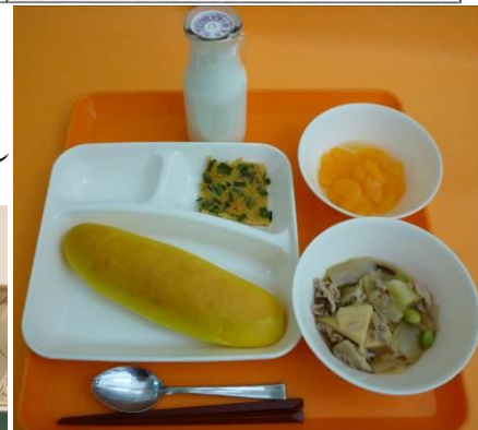
学生の食事について学習し