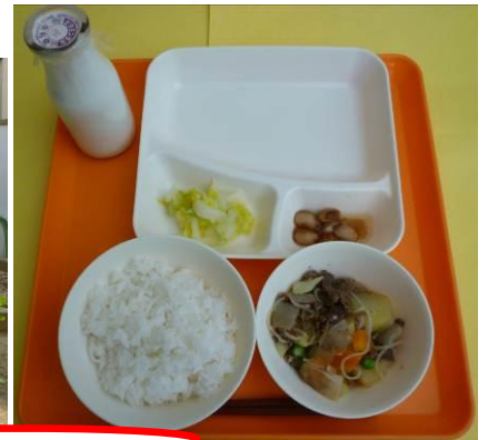
昨日の4年生と6年生の「さよなら給食」の様子です。