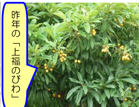
昨年の「上福のびわ」