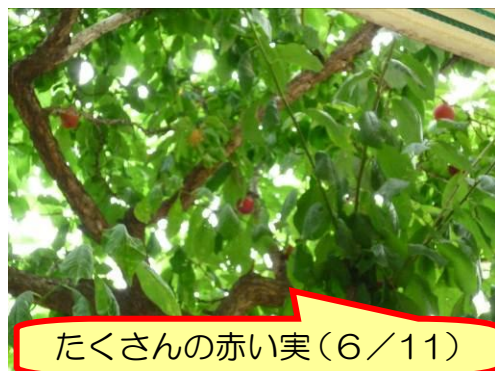
たくさんの赤い実(6/11)

○みなさんは気づいていましたか？先週木曜日、「上福のすもも」がたくさん色づき、明日どこかの学年に収穫してもらおうと管理作業員さんと相談していました。ところが、金曜日見てみると、赤い実一つとまだ熟していない緑色の実一つを残して、どうやらカラスが全部食べてしまったようです。それ以外に「上福のびわ」も今年は一つも見当たらないのです。どうやら、自然の恵みを心待ちにしているのは、人間だけではないのですね。