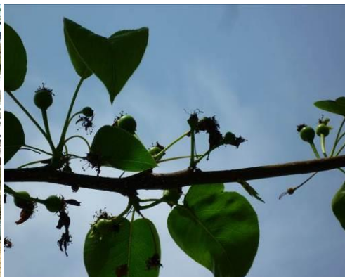
4月25日 小さい小さい実