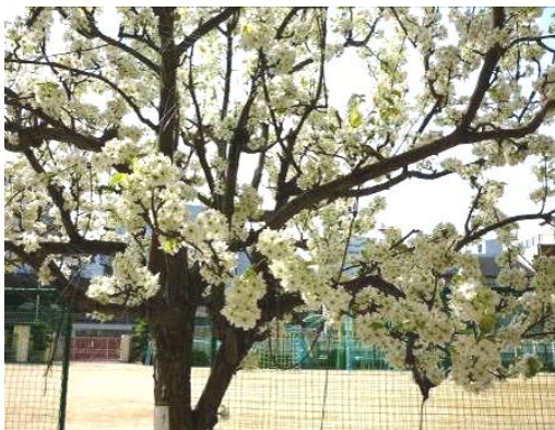
4月11日 満開のなしの花

★なしはバラ科の植物で、春には桜のような白い花がいっぱい咲きました。覚えていますか？やがて、花から実へ。実が小さな間は上を向いていましたね。