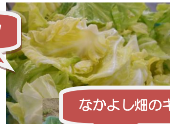
なかよし畑のキャベツ