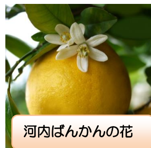
河内ばんかんの花