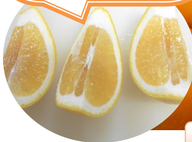
熊本県産の河内ばんかん