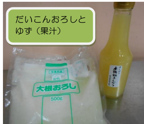
だいこんおろしと ゆず(果汁)

なかよし畑には、5年生が発芽実験後に植えたとうもろこしやおもちゃかぼちゃも 育ってきています。玉造黒門越瓜 しらうり の実もできてきています。