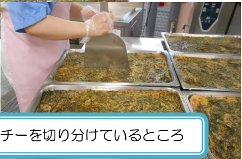
ヒラヤーチーを切り分けているところ

○今日の給食は「もずく入りヒラヤーチー」です。 ヒラヤーチーは、沖縄県の家庭料理です。 沖縄県の言葉で、平焼きのことをヒラヤーチーといいます。大阪のお好み焼きのように、小麦粉、卵、水を混ぜ合わせて具材を入れた生地を平たくのばして焼きます。 給食では、沖縄県産のもずくを使用しました。 焼いた後、たれをかけて切り分けます。