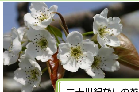
二十世紀なしの花