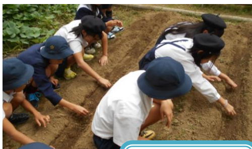
田辺だいこんを 植えているところ