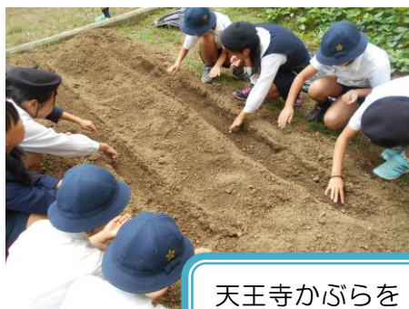
天王寺かぶらを 植えているところ