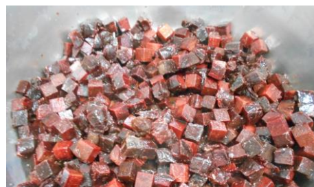
くじらに下味をつけているところ

給食では、しょうが汁、料理酒で下味をつけてでんぷんをまぶし油であげたくじらに、ケチャップ、さとう、赤みそを合わせたオーロラソースをからめました。