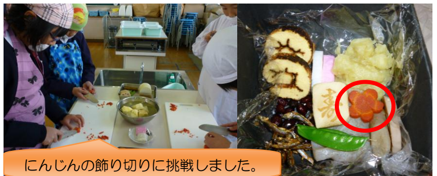
にんじんの飾り切りに挑戦しました。

○6年生は、お重代わりの紙箱に、とても上手に「おせち料理」を盛り付けることができました。金時にんじんで、梅型の飾り切りをしました。少しの工夫で、とてもお祝いらしさが出ました。にんじんの切れ端もすべて残さずいただきました。さつまいものお礼に、1・2年生に「きんとん」をおすそ分けしました。