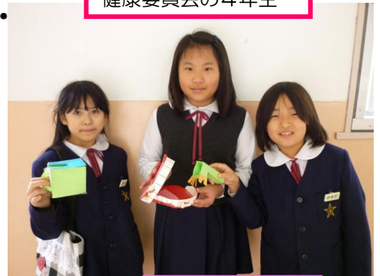
健康委員会の4年生

○昨日は2年生と5年生の教室に行きました。30回かむときに、歯型を動かすと、知らず知らずかむことに集中できていました。とても素敵なアイデアです。