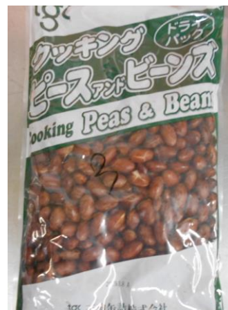
金時豆(ドライパック)

○今日で今年度の給食も終わりです。みなさんは、今年学校で、195日ほど給食を 食べました。給食では、毎日たくさんの食品を使っています。給食を通じて食品の ことなどを学んでほしいと思います。来年度も給食をしっかりと食べて元気な体をつ くっていきましょう。4月10日(火)から給食がはじまります。