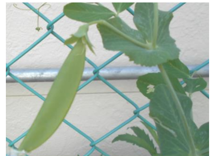
なかよし畑のさやえんどう