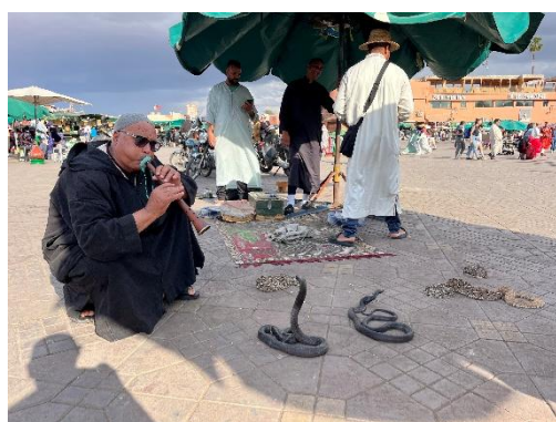
フナ広場のヘビ使い 音楽に合わせてつぼの中から・・・！

2024年3月まで上福島小学校の先生をしていました。今はJICA海外協力隊員として、モロッコの学校で活動しています！