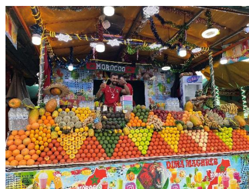
フルーツジュース屋さん 注文するとその場でしばって作ってくれるよ！