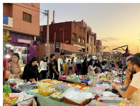
夜になるとたくさんの人達でにぎわうよ