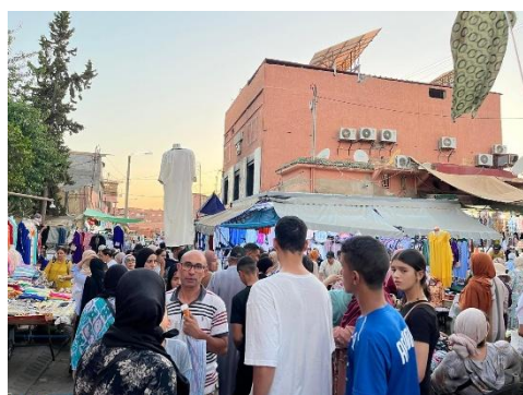
服のお店が並ぶエリア