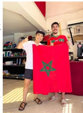
↑モロッコのことなどいろいろと 教えてくれる友だち

さて、今日は「スーク」について紹介します！モロッコには、スークとよばれる市場があります。そこでは、食べ物だけでなく、服やかばん、食器や調理器具など、生活に必要なものがなんでもそろっています。スーパーとはちがって、値段が書いていないことがほとんどなので、値段を話し合っ(交渉して)買いものをします(これがまた大変・・・)。スークの中にはたくさんのお店がひしめき合っ(並んでいる)ので、道がとてもせまい・・・！たくさんの方がせまい道を通るので、少しの距離を進むのも一苦労。でも、活気にあふれていて、モロッコの人達の暮らしや文化を知ることができる、モロッコがぎゅっと詰まった場所です！