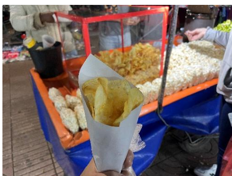
たべものの屋台もあるよ