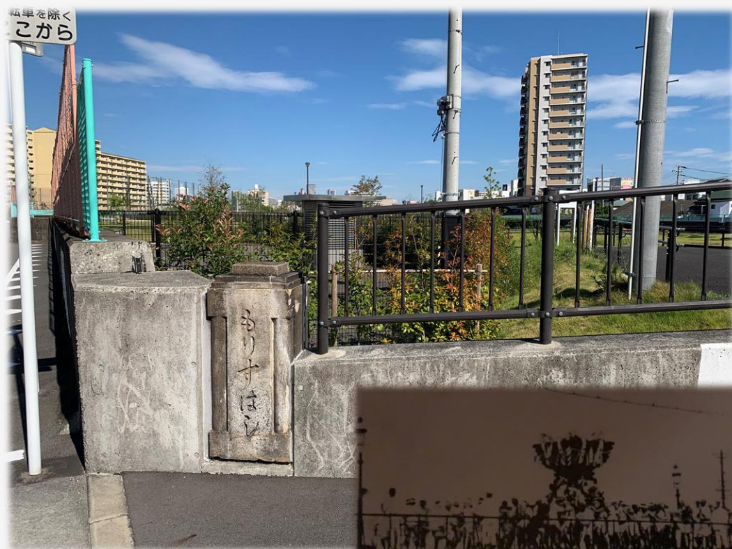
大正8年ごろの森巢橋 →