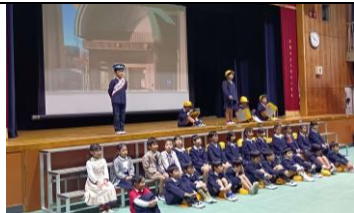
2年 九条南の町をたんけんしたよ！