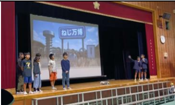
5年 2025 大阪・ねじ万博