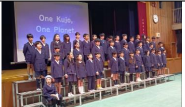
4年 One Kujo, One Planet