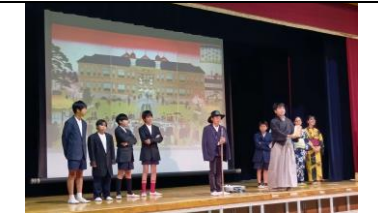
6年 時をこえて、未来へつなぐ