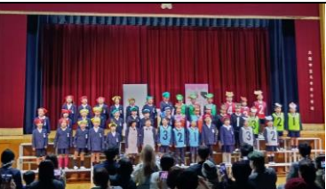
1年 手と手をつないでなかよくしよう

11月15日（土）・20日（木）に学習発表会が実施されました。たくさんの保護者や地域の方にお越しいただき、ご声援や大きな拍手をいただき、本当にありがとうございました。子ども達は、学習発表会を通して、一つのことを成し遂げるためには、自分自身が全力を尽くし、みんなと心をつなげて協力し合うことが大切だということ学びました。今回の学習発表会に向けた取り組みの中で、さまざまな「役割」を担うという責任が、子ども達をさらに成長させたように感じます。それぞれの学年が、練習の成果をしっかりと出すことができた学習発表会となりました。