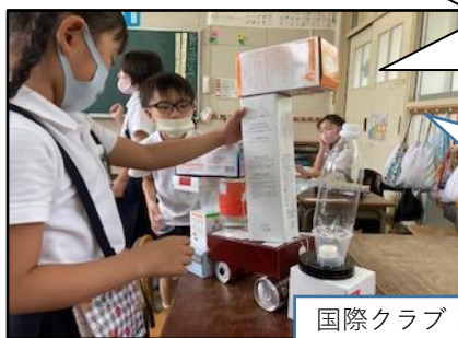
1年算数科 「いろいろな かたち」