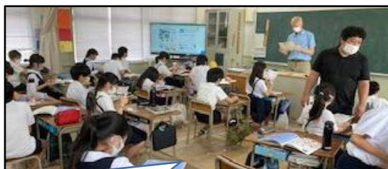
外国語（高学年）：C-NETの講師を派遣していただき、 週2時間取り組んでいます。