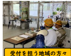
受付を担う地域の方々

個人懇談会では、猛暑の中、学校に足を運んでいただきありがとうございました。限られた時間ではありましたが、お子さんの学校での学習面や生活面についてお話ししたり、ご家庭での様子を伺ったりすることができ、とても有意義な時間となりました。また、懇談会期間中、地域の皆様が玄関での受付を担っていただきましたことにも深く感謝申しあげます。誠にありがとうございました。