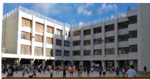
朝のラジオ体操(昨年度)

明日より39日間の夏休みが始まります。これまでは学校での生活が中心でしたが、夏休みは家庭や地域での生活になり、従来から「子どもを家庭に返す」とも言われてきました。夏休みは時間的に余裕があり、子どもは時間を自分で管理することができる機会でもあります。時間という資源を有効に活用して、夏休みだからこそできることを考えて、チャレンジさせたいものです。