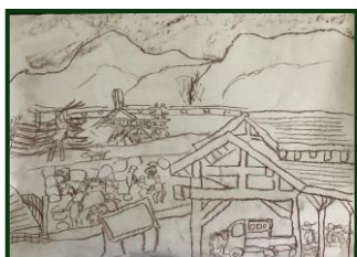
津黒高原のスケッチ(by 左海)

今日の子どもたちは、ICTや映像機器の発達により、非現実的でバーチャルな世界で、物事を理解してしまう傾向があり、子どもたちの体験不足が危惧されています。昔から、「聞いたことは忘れ、見たことは覚え、やってみたことは理解する」と言われてきました。学校でも、授業の中に教科書だけでは学べないことを学べる体験学習を組み入れていくことが必要であると考えています。