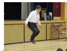
必死に跳びました

2月は新1年生の入学説明会、保・小交流会、6年生お別れ会、招待給食、作品展、見守り隊との交流会、学習参観・学級懇談会など、1年を締めくくる行事がたくさん予定されています。