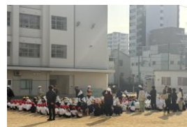
運動場への1次避難完了

さて、1月16日(金)の休み時間、子どもたちへの予告なしに、地震を想定した避難訓練を実施しました。 地震発生 の放送直後、 運動場 や廊下で 身をかがめる子 、 教室で机の下に逃げこむ子 、そして、 揺れがおさまると防災頭巾を身に付け逃げる準備にとりかかる子 もいて、一人ひとりが自分の 安全を守りながら運動場へ避難し、これまでの訓練の成果が生かされた取組となりました 。31年前の1月17日の阪神淡路大震災の当日、聖和小学校の担任であった私は、JR環状線が止まり、新今宮駅から歩いて学校にやっとの思いで昼前に到着。子どもはすでに全員早退し臨時休校。静まりかえった校舎の全ての防火扉が揺れて閉まり、職員室では対応の電話が鳴り響いていたことを覚えています。今後も「 災害は忘れた頃にやってくる 」の戒めを教訓にして、 防災・減災教育や対策を行っていきます 。