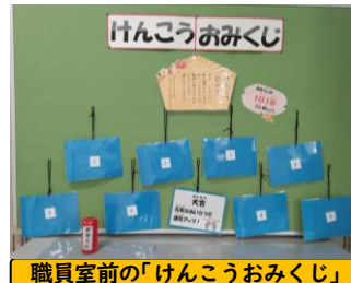
職員室前の「けんこうおみくじ」

子どもたちは、おみくじが大好きです。職員室前の「けんこうおみくじ」コーナーでは、毎朝、登校した多くの子どもたちが、1日の自分の運を託してくじを引き、「大吉(元氣なあいさつで運氣アップ!)」が出た子は「よっしゃー」、「小吉(寝不足に注意!今日はいつもより早く寝よう!)」の子は「まあええやん」、「凶(学校のルールを守らず廊下・階段を走ると友だちにぶつかって痛い思いをするかも...)」の子は「ええ〜」と、ちょっとした悲喜こもごものシーンが繰り広げられています。何はともあれ、 健康を大切にして、子どもたちみんなが元気に過ごせる1年でありますように 願い、私もおみくじを引いています。