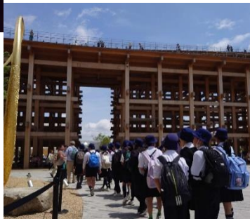
6年 大阪・関西万博