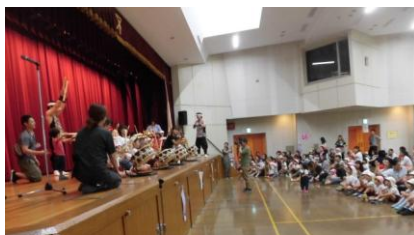
浪速区太鼓集団“怒”さんによる迫力ある演技でした。

子どもたちも元気に園庭で色水遊びをしたり、プール遊びをしたり、この時期ならではの活動を存分に楽しんでいます。これからも、今の時期にしかできない遊びを展開していきたいと思っています。