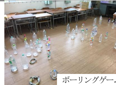
ボーリングゲーム！