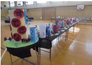
2年「すてきなぼうし」