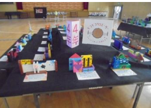
4年「ギョギョクリエイター」