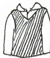
紺色のベストの着用