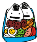
イラストはイメージです。

会食では、なにわフードバンク“しっ かり食べや”、こどもの居場所サポート おおさかを通じて多くの団体、企業、 個人の方々から食材を提供していただ いております。お米やお肉、簡単に調 理できる冷凍食品、ジュースやお菓 子・デザートなどを使用しています。