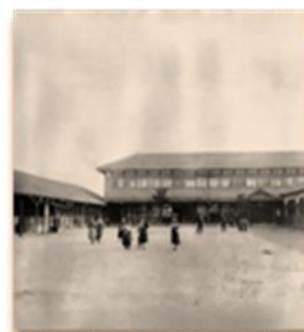
大正時代の大和田小学校

本校は1874年(明治7年)「西成郡第6大区5小区第7番小学校」として誕生し、今年度は創立146年を迎えます。保護者・地域の皆様方と共に大和田小学校の教育活動は繰り広げられ、この歴史と伝統は、脈々と児童に受け継がれています。6月15日(月)の放送朝会のおりに、子ども達に話をしました。機会を見て、さらに歴史と伝統を子どもたちと共に振り返りたいと思います。