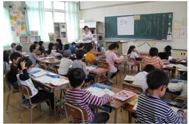
2年 風のゆうびん屋さん