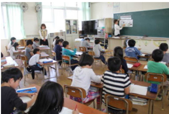
3年 時こくと時間のもとめ方を考えよう