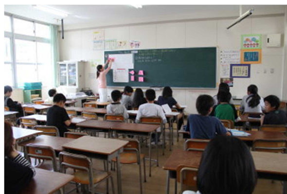
6年 対称な図形（習熟度教室）