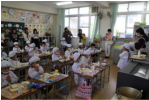
1年 おいしい給食 いただきます！