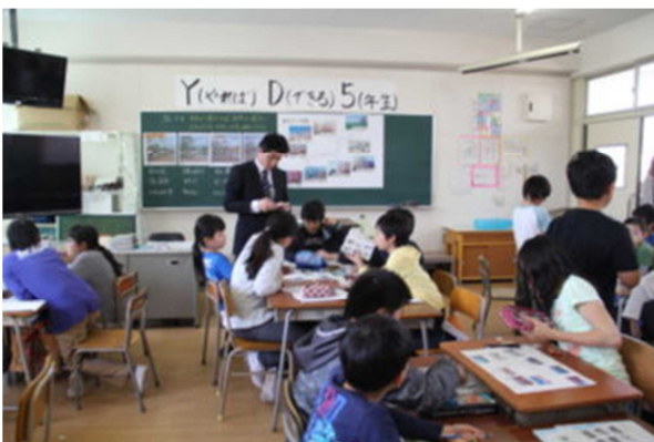
5年 日本の地形と気候