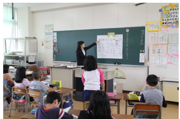
4年 漢字辞典の使い方を知ろう